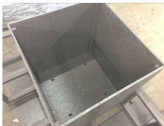
中央にフランターを配置