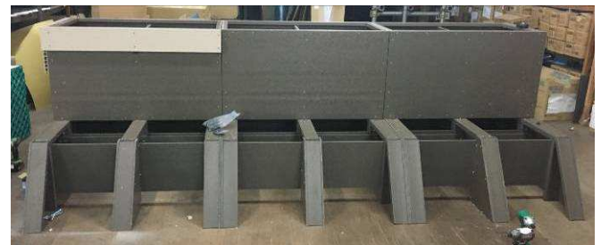
リズラフ ボードとリズラフ角材で土台骨組みを製作 正面