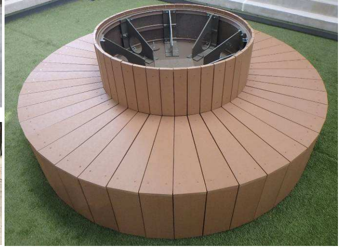
フランター付きテッキ貼り曲面ベンチ 直径 2,000mm 植栽直径 1,000mm 植栽高さ 300mm 座面 H400mm 奥行き 500mm 希望小売価格 510,000 円