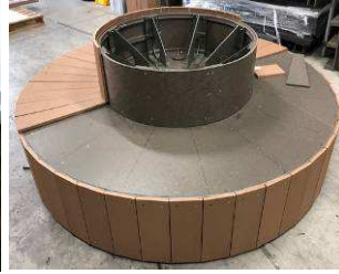
テッキ材を円形用に寸法取りして貼り付け