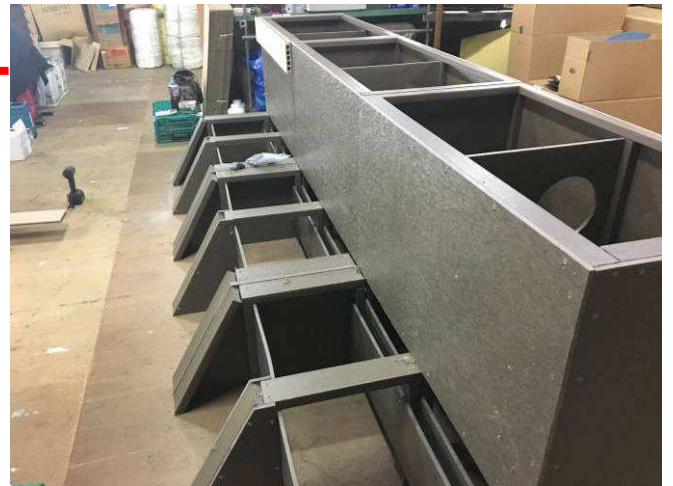
リズラフ ボードとリズラフ角材で土台骨組みを製作 側面