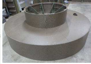
リズラフ 曲面ベンチ土台完成