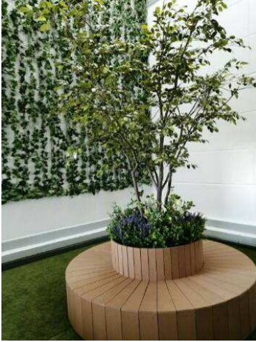
円形ベンチの中央に植栽 (室内)