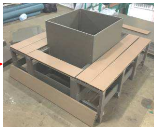
土台骨組みにバイタルデッキ材を貼り付け