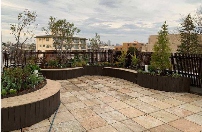
リズラフ 曲面庭園付きベンチ 東京都世田谷区