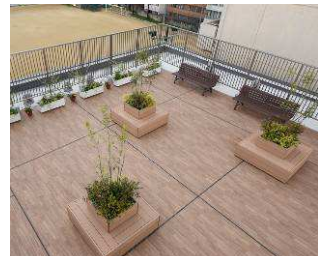
仕上り品を現場に送り、そのまま設置