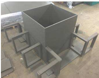
リフライフボードとリフライフ角材で土台骨組みを製作