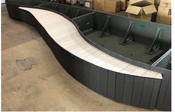
リズラフ ボードで曲面庭園及びベンチ製作 ベンチ部にテッキ板貼り