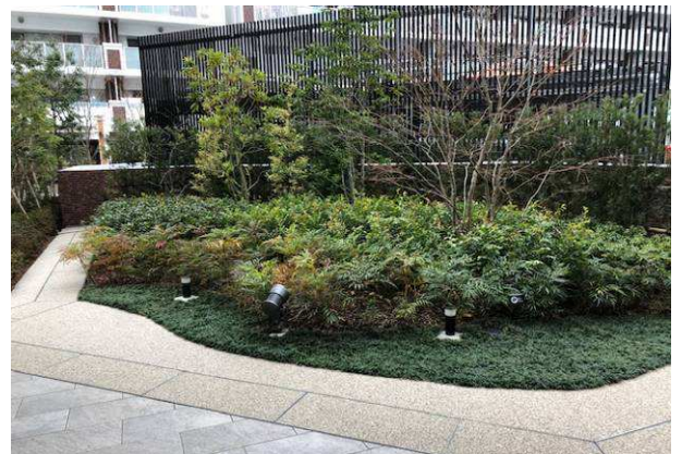
神奈川県横浜市屋上庭園