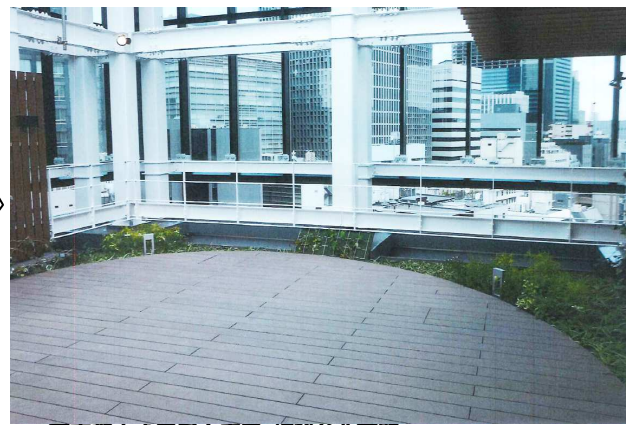
東京都中央区屋上庭園 複雑な曲面壁