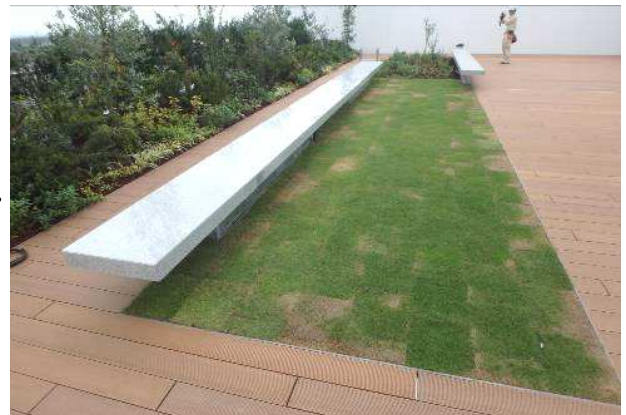
埼玉県所沢市 屋上庭園