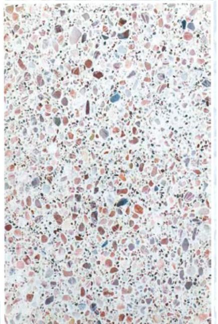
デコリエブライツ ホワイト 粉体 10kg に対する調合：ビューティーピンク 5 mm・9kg 鳴門(紅サンゴ) 1.5mm・6kg ※骨材変更・廃盤 代替品になるので写真とは異なりますのでご注意ください。